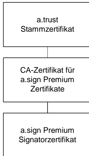
Abbildung 1 Zertifizierungshierarchie